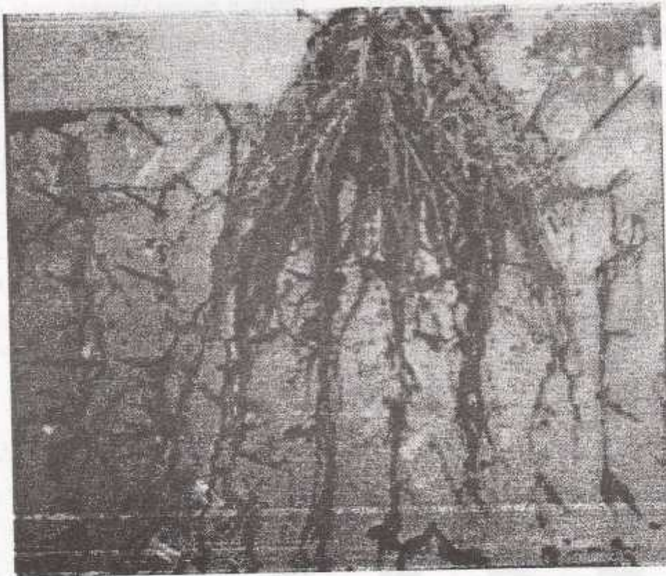
Gambar 2. Akar yang diambil dengan menggunakan teknik pinboard