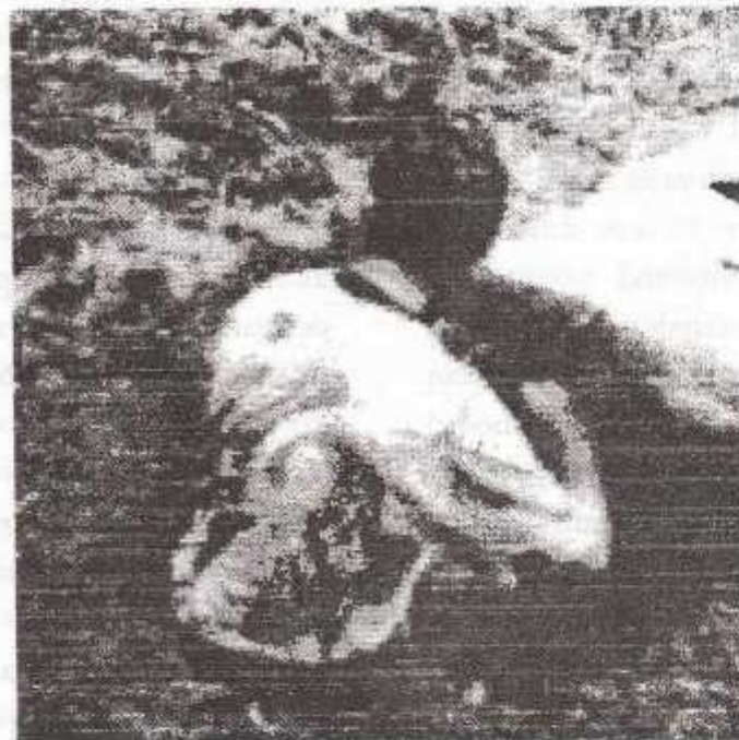
Gambar 1. Pelaksanaan teknik mapping dengan menggali profil