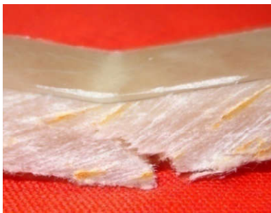
Gambar 3. Penampang patahan kegagalan bending dengan Vf = 40% waktu alkali 2 jam

Kegagalan bending komposit ditunjukkan pada gambar 3. Secara umum, pola kegagalan diawali dengan retakan pada komposit skin yang menderita tegangan tarik pada sisi bawah dan tegangan tekan pada sisi atas. Kemudian, beban bending tersebut didistribusikan pada skin sehingga menyebabkan mengalami kegagalan fiber pull out.