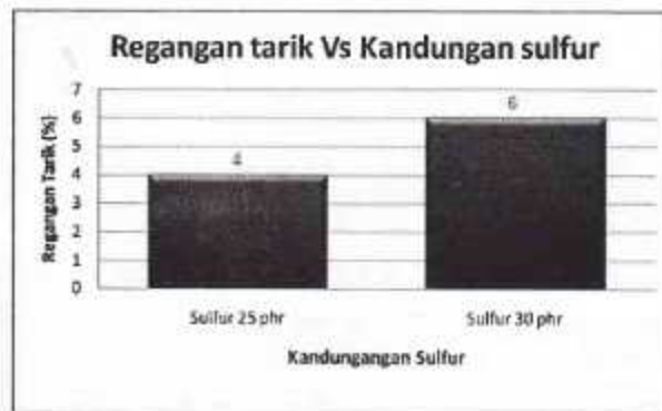
Gambar 3. Histogram regangan tarik