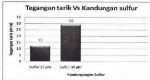
Gambar 2. Histogram tegangan tarik