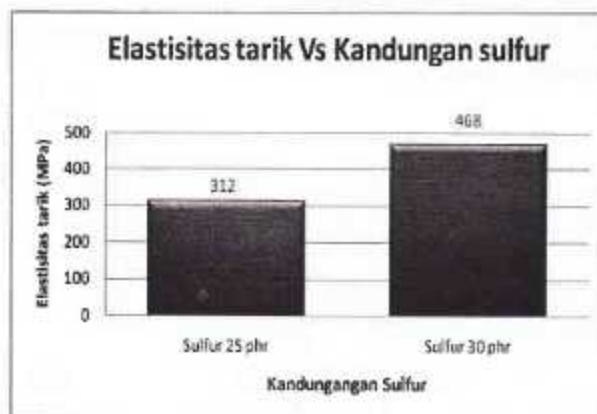
Gambar 4. Histogram elastisitas tarik