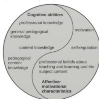
Gambar 1. Kompetensi Profesionalitas Guru

dibutuhkan guru SD yaitu kompetensi pedagogik, kepribadian, profesional dan kompetensi sosial (Sukirman 2012). 38 Guru yang berkualitas adalah guru yang memiliki keempat kompetensi dimaksud yaitu memiliki pengetahuan yang mendalam dan luas tentang materi yang menjadi bidang keilmuannya, memiliki pengetahuan yang baik tentang sifat dan karakter peserta didik, mengetahui tujuan pendidikan dan metode untuk mencapai kompetensi yang akan dicapai. Komponen profesionalisme guru yang melibatkan bukan hanya pengetahuan melainkan keterampilan dalam mengelola kelas. Sebuah model yang mengidentifikasi kemampuan kognitif dan karakteristik afektif, motivasi sebagai dua komponen utama kompetensi profesional guru (Gambar 1).