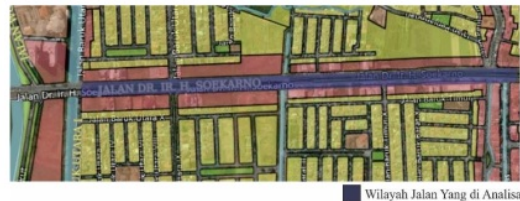
Gambar 3. Jalan Ir.H.Soekarno-Hatta

Jalan DR.Ir.H. Soekarno-Hatta, juga dikenal sebagai MERR ( Middle East Ring Road atau Jalan Lingkar Dalam Timur Surabaya) adalah sebuah jalan lingkar sepanjang 10,98 km yang menghubungkan antara daerah Kenjeran, Surabaya dengan Tambak Sumur, Waru, Sidoarjo, Jawa Timur. Jalan ini melintasi bagian utara, timur, dan selatan Kota Surabaya serta bagian timur laut Kabupaten Sidoarjo. Jalan lingkar ini menjadi jalan penghubung antara Jembatan Nasional Suramadu dengan Bandara Internasional Juanda via Jalan Tol Waru-Juanda.