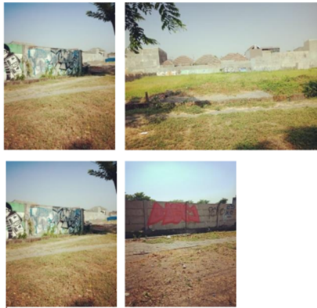
Gambar 5. Vandalisme di Jalan Ir.H.Soekarno-Hatta

Ternyata kerapatan antar bangunan juga bisa menjadi salah satu penyebab ada tidaknya