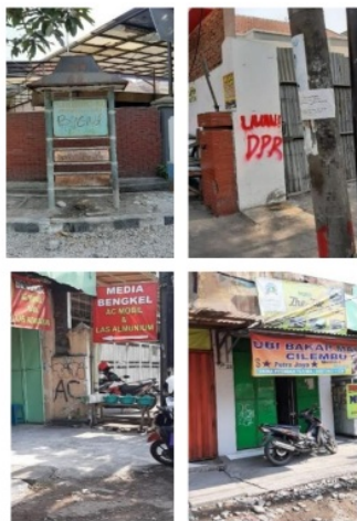
Gambar 2. Vandalisme yang ada di jalan Rungkut Madya