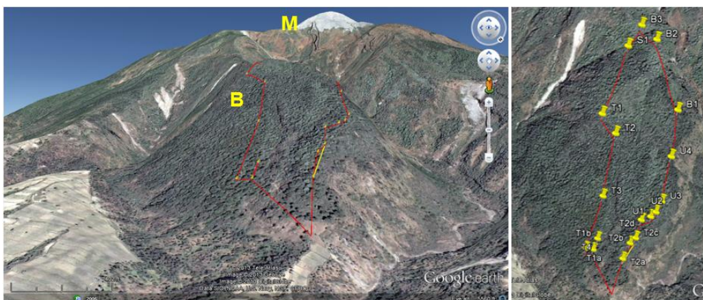
Gambar 1. Area penelitian Bukit Bibi difoto dari ketinggian 3731 m (kanan). Keterangan: garis merah (jalur jelajah); B (Bukit Bibi); M (Gunung Merapi)

Kecamatan Cepogo, Kabupaten Boyolali, Provinsi Jawa Tengah. Luas Bukit Bibi \pm 1 Ha. Bukit Bibi termasuk dalam zona rimba dengan ketinggian puncak \pm 2007 mdpl, curah hujan 3200 mm/tahun dan suhu maksimal 22° C.