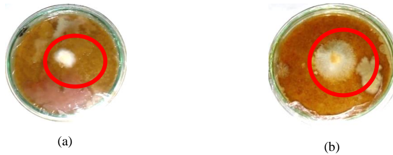
Gambar 2. Pertumbuhan miselium jamur paling optimal dengan konsentrasi tepung jiwawut 15% (a) jamur tiram dan (b) jamur merang