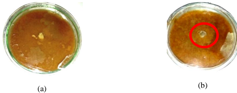
Gambar 3. Pertumbuhan miselium jamur yang tidak optimal dengan konsentrasi tepung jiwawut 20% (a) jamur tiram dan (b) jamur merang