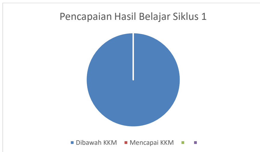
Gambar 1. Pencapaian hasil belajar pada siklus 1

Berdasarkan hasil belajar siswa pada siklus pertama dengan penggunaan student worksheet tidak terdapat siswa yang memenuhi nilai KKM.