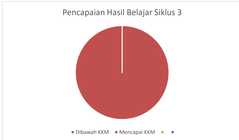
Gambar 3. Pencapaian hasil belajar pada siklus ketiga

pembelajaran yang sudah tepat maka dapat digunakan sehingga hasil belajar siswa dapat meningkat (Mulyono et al., 2020).