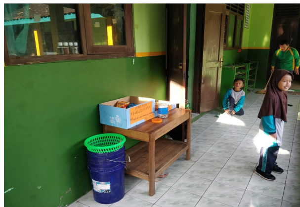
Gambar 1. Kardus yang Berisi Berbagai Macam Jajanan Anak

Kegiatan selanjutnya berupa pendampingan dalam pelaksanaan program kantin anti korupsi. Deskripsi kantin anti korupsi sebagai media penanaman karakter kejujuran siswa di SD/MI Ngargorejo, Ngemplak, Boyolali sebagai berikut. Kantin anti korupsi yang terbentuk di SD/MI Ngargorejo Ngemplak Boyolali masih sangat sederhana bahkan belum layak untuk menjadi sebuah kantin. Kantin yang berada di SD/MI ini hanya berbentuk dua buah kardus yang berisi berbagai macam jajanan anak yang diletakkan di atas meja (Gambar 1) sebagai tempat meletakkan jajanan tersebut.