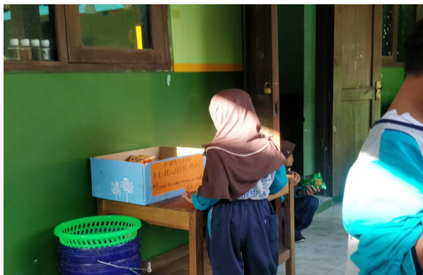
Gambar 3. Proses Transaksi Siswa pada Kantin Anti Korupsi

Penanaman karakter kejujuran terjadi pada saat siswa melakukan transaksi jual beli di kantin anti korupsi. Melalui kantin anti korupsi, siswa dilatih untuk melakukan kejujuran yaitu kejujuran dalam berinteraksi karena siswa melakukan transaksi jual beli di kantin anti korupsi tanpa ada orang lain yang menunggu kantin tersebut (Gambar 3).