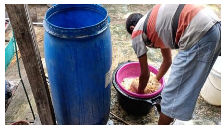
Gambar 3. Pemilihan Usus

Memilih usus adalah tahap awal dimana sebuah proses yang akan diproduksi berhasil dan sesuai. Dari pihak warga yang mempunyai usaha keripik usus tersebut juga memberikan arahan kepada tim dan pegawainya untuk menyelesaikan dari tahap awal sampai akhir. Pertama memilih usus terlebih dahulu dan memisahkannya dari lemak yang menempel.