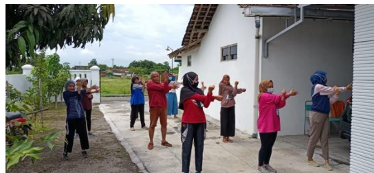
Gambar 11. Kegiatan Senam