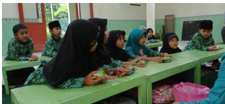
Gambar 10. Pembagian Hadiah pada Murid yang bisa Melafalkan Huruf Arab