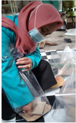
Gambar 6. Mengemas Usus