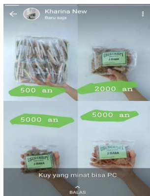
Gambar 7. Mempromosikan Usus Goreng di Media Sosial

Untuk membuat usaha usus goreng 3 Dara ini menjadi meningkatkan pelanggan dan dikenal banyak orang tim mempromosikan usaha usus goreng 3 Dara ini di media sosial tim. Selain tim mempromosikan usaha usus ini ke media sosial, tim juga mengajarkan kepada pemilik usaha untuk mempromosikan usaha ususnya melalui media online agar dapat meningkatkan pendapatan dan mengembangkan usaha.