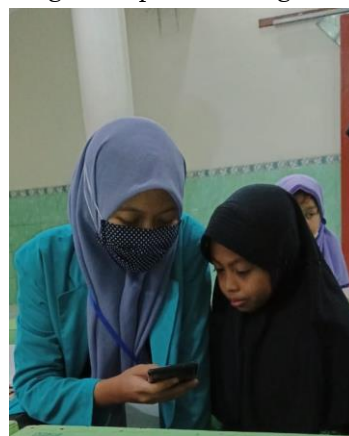
Gambar 9. Mengajarkan Aplikasi Digital

bisa belajar dirumah karena tidak ada yang mengajari untuk itu tim mengenalkan aplikasi ini. Dengan teknologi yang terus berkembang, pemanfaatan teknologi tidak hanya dapat diimplementasikan di ranah pembelajaran formal, namun juga dapat dimanfaatkan untuk belajar mengaji Al-Qur'an dan membaca Iqra'. Tim juga mengajarkan fungsi-fungsi seluruh item dalam aplikasi seperti jika tidak tahu melafalkan bisa menghidupkan suaranya agar aplikasi bisa melafalkan bunyinya. Maka saat mereka dirumah juga bisa belajar agar cepat bisa dan mengalami perkembangan.