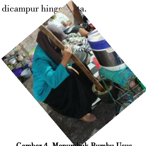
Gambar 4. Menumbuk Bumbu Usus

bumbu, tim mencuci terlebih dahulu bahan yang akan diracik, kemudian setelah memotong bahan/ bumbu tersebut sesuai dengan yang dibutuhkan dan tahap selanjutnya yaitu ditumbuk sampai semuanya dan kemudian di blender agar hasilnya rata. Kemudian usus tepung dicampur hingga rata.