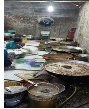
Gambar 5. Proses Penggorengan Usus

Saat proses penggorengan ini merupakan proses dimana tahap yang ketiga sudah selesai dari tahap ke satu dan kedua tersebut. Proses penggorengan ini merupakan proses yang akan dilakukan secara keseluruhan secara bersamaan dimana usus tersebut sudah dalam bersih dan sudah diracik dan ditumbuk maupun diblender dan dicampur menjadi satu sama tepung. Saat proses penggorengan ini tahap yang pertama tim melakukan penggorengan dengan banyak sesuai dengan wajan yang tim gunakan. Setelah tim tuangkan proses penggorengan tersebut ke dalam wajan. Tim tunggu dulu sekitar 20 menit karena penggorengan langsung banyak jadi memerlukan waktu yang lama. Setelah penggorengan selesai di ditiriskan dulu berapa menit dan tidak langsung dikemas karena biar gak panas dan tidak lembab.