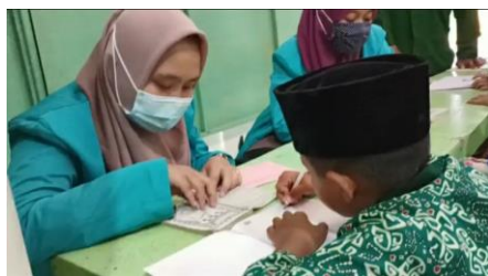
Gambar 8. Aktivitas Diklat Menulis