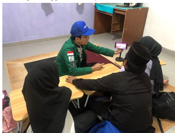
Gambar 3. Nonton Bersama tentang Film Perumusan Teks Proklamasi

Tidak hanya melakukan edukasi karakter berkaitan dengan nilai-nilai karakter pelajar pancasila. Untuk meningkatkan rasa nasionalisme yaitu dilakukan kembali proses menonton bersama mengenai peristiwa perumusan teks proklamasi sebagai proses edukasi nasionalisme terhadap anak-anak imigran Indonesia yang bertempat tinggal di Malaysia.