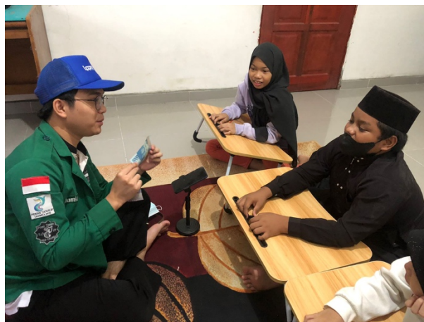
Gambar 4. Edukasi Nasionalisme melalui Pengenalan Mata Uang Rupiah Republik Indonesia

rupiah republik Indonesia yang sama sekali mereka belum pernah memegangnya.