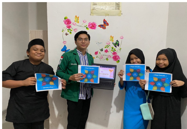
Gambar 2. Edukasi Nilai-nilai Karakter Pelajar Pancasila

Perwujudan enam karakteristik Pelajar Pancasila adalah dengan menumbuhkan kembangkan nilai-nilai budaya Indonesia dan Pancasila, yang menjadi landasan pembangunan nasional (Juliani and Bastian 2021).