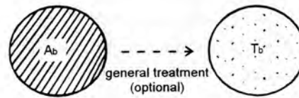
GAMBAR MODEL I

Ab : daerah asal dengan kondisi wilayah (b) Tb : daerah tujuan dengan kondisi wilayah mirip dengan kondisi wilayah (b).