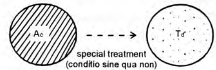
GAMBAR MODEL II

Ac : daerah asal dengan kondisi wilayah (c) Td : daerah tujuan dengan kondisi wilayah (d)