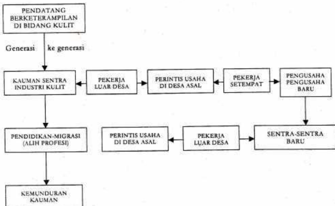
Gambar 2. Pola Difusi Usaha Perkulitan Di Magetan

Keberadaan usaha perkulitan di Magetan pada awalnya berasal dari luar daerah kemudian berkembang secara turun menurun menjadi tradisi. Dari