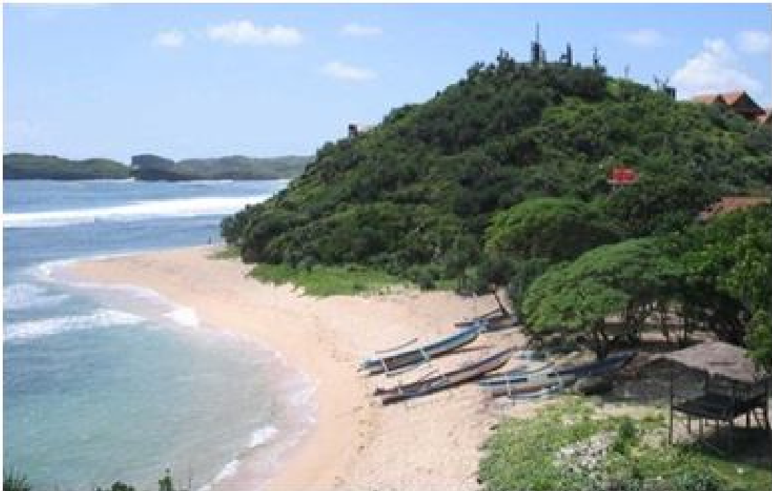
Gambar 3. Tipologi Wave Erosion Coast di Sebelah Barat Pantai Siung