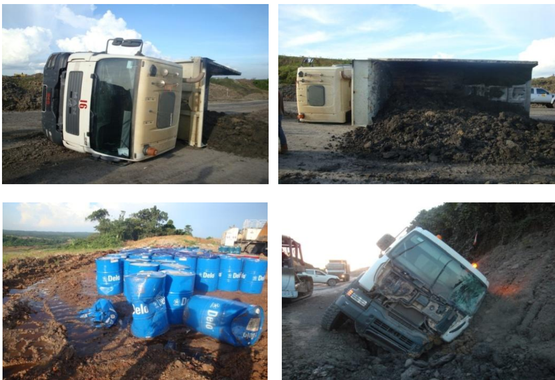
Gambar 1. Kasus Kecelakaan PT. XYZ dari Oktober 2010- Juli 2011

Pada bulan Juli 2011 terjadi peningkatan kasus kecelakaan yang sangat signifikan yaitu 23 kasus kecelakaan dari kasus kecelakaan bulan sebelumnya 8 kasus kecelakaan. Berdasarkan hasil pengamatan dan data perusahaan peningkatan kasus kecelakaan tersebut terjadi merupakan efek domino dari kasus kecelakaan sebelumnya dan sistem penerimaan tenaga kerja lokal (warga sekitar) yang tidak melalui sistem perekrutan karyawan sesuai prosedur. Kasus kecelakaan bulan-bulan sebelumnya dan perekrutan karyawan tanpa keahlian khusus merupakan penyebab utama tidak tercapai target produksi dari perusahaan sehingga sehingga berdampak negatif terhadap lingkungan hidup yaitu beberapa kasus kecelakaan yang terjadi mengakibatkan pencemaran terhadap lingkungan hidup dan kerugian perusahaan dari segi ekonomi karena banyak biaya-biaya yang harus dikeluarkan untuk perbaikan alat, membayar gaji karyawan serta pemulihan lingkungan hidup yang tercemar tumpahan oli.