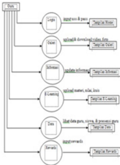
Gambar 2. DFD Level 2 Proses Guru