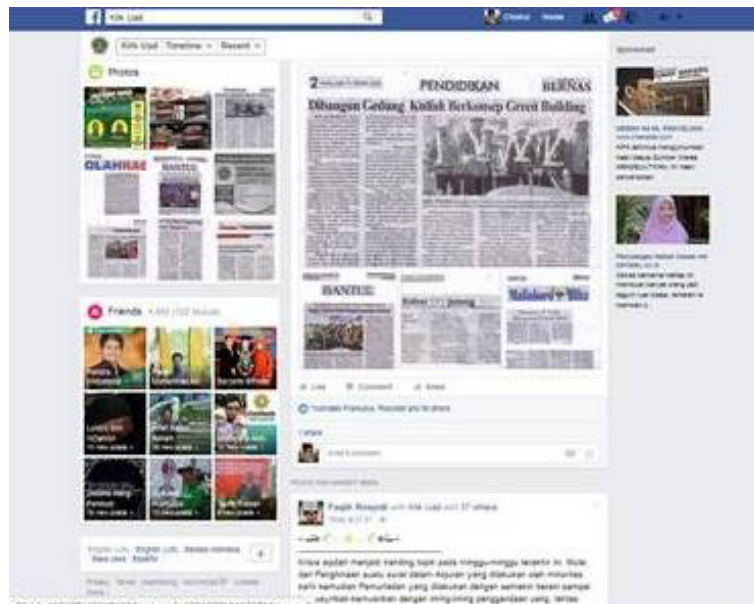
Gambar 2. Konten di Media Social UAD "Klik UAD"

mempunyai social media sendiri, untuk media publikasi baik internal maupun eksternal. Konten-konten informasi yang menarik dan mudah dipahami menjadi salah satu karakteristik pengelolaan social media yang bisa dilakukan.