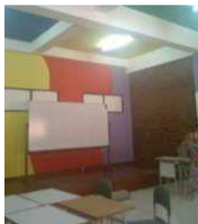
Gambar 9. Ruang Kelas di SAIMS

cerah untuk merangsang anak untuk kreatif dalam belajar. Furniture seperti papan tulis, meja, dan kursi digunakan menyesuaikan dengan skala tubuh anak. Terdapat area di dinding untuk memamerkan hasil karya anak.