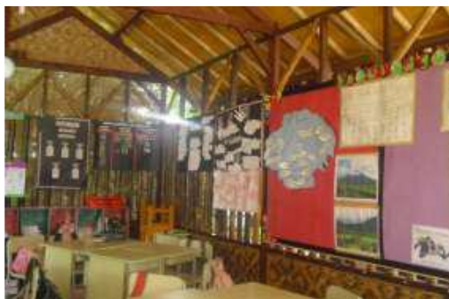
Gambar 13. Ruang Kelas.

Ruang kelas menggunakan material kayu dan bambu dengan konsep kelas saung di area terbuka.