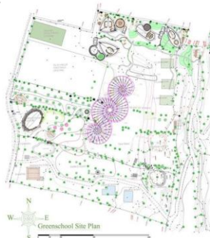
Gambar 6. Site plan Greenschool Bali.

Green School Bali didirikan pada tahun 2006 oleh John Hardy. Sekolah dibuka pada September 2008 dengan 90 siswa dan sebelumnya merupakan lahan perkebunan dan sawah. Sejak saat itu secara fisik dan jumlah murid terus mengalami peningkatan setiap tahun.