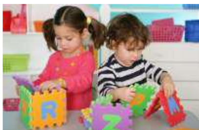
Gambar 1. Anak Bermain dengan Puzzle Warna.