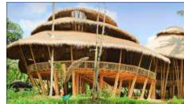
Gambar 7. Tampak Greenschool Bali.

Sekolah ini melakukan inovasi dengan mengambil bentuk unik yang tidak akan ditemukan di sekolah lain. Material utama dari bangunan di sekolah ini adalah bambu, alang-alang, rumput gajah, dan tanah liat di atasnya (lihat gambar 6). Semua konstruksinya merupakan material alam yang dapat di daur ulang dan juga mempunyai nilai lokalitas. Ruang kelas di desain tanpa sekat dan dinding beton sehingga memaksimalkan penghawaan alami. Green School di Bali, Indonesia memberikan pendidikan alam, holistik dan berpusat pada siswa. Meskipun mata pelajaran konvensional juga turut diajarkan, Green School lebih menekankan pada metode pendidikan yang berbasis holistik, mempersiapkan siswa siswinya menjadi individu yang kritis, kreatif, serta sadar lingkungan. Ini berarti, selain mempelajari algoritma, para siswa.