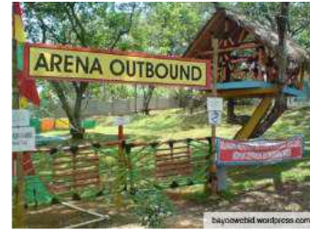
Gambar 14. Area Outbond .

Area Outbond dilengkapi dengan fasilitas yang bermanfaat untuk mendekatkan diri dengan alam dan juga melatih kemandirian, sosial dan kepercayaan diri anak.