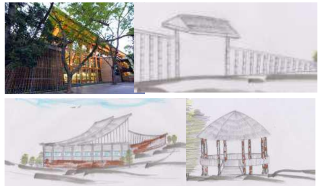
Gambar 15. Gambar Tampilan Bangunan

Pagar terbuat dari bambu. Tanaman bambu dapat berfungsi sebagai barrier suara dan juga merupakan material yang disediakan oleh alam. Bangunan penerima dan pengelola menggunakan material bambu dan kayu memberikan kesan menyatu dengan alam. Untuk bagian atap menggunakan bahan ijuk yang dibuat bertumpuk. Ruang kelas merupakan saung dari kayu dan bambu tanpa dinding.