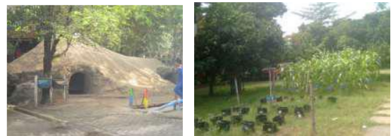
Gambar 8. Salah Satu gua ruang pembelajaran anak dan Area pembelajaran bercocok tanam di SAIMS

Sekolah Alam Insan Mulia Surabaya (SAIMS) menerapkan model pembelajaran yang membuat anak tetap riang gembira di saat sekolah berlangsung ( joyful learning ). Prinsip dasarnya adalah anak akan belajar secara efektif bila dia berada dalam kondisi fun dan nyaman. Sekolah didesain menjadi tempat belajar yang menyenangkan sehingga anak menjadi kerasan. Siswa tidak hanya belajar di dalam kelas, tetapi juga belajar di ruang terbuka, alam bebas maupun di arena bermain edukatif. Di SAIMS siswa belajar kecakapan hidup ( life skill ) secara utuh tidak parsial seperti di sekolah konvensional.