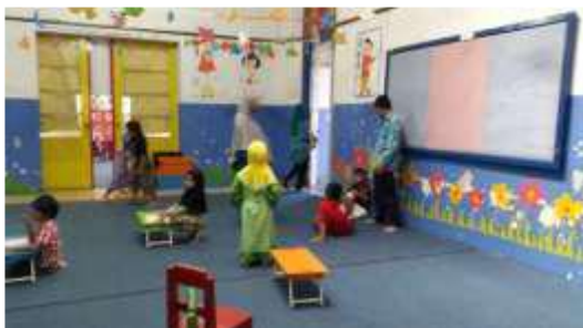
Gambar 10. Ruang kelas di TK Lazuardi.

Fasilitas ruang kelas di cat dengan warna biru memberikan kesan sejuk dan tenang dengan ornamen. Terdapat juga karya siswa yang digantung sebagai pemanis interior. Lantai ditutupi dengan karpet untuk menambah faktor keamanan anak.