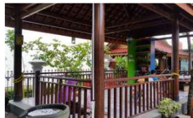
Saung ruang bakat