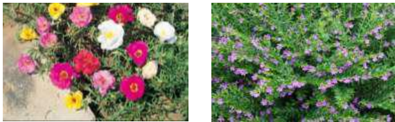
Gambar 12. Sutra Bombay dan Taiwan Beauty .

Terdapat tanaman hias untuk menambah faktor estetika. Menggunakan taman bunga dengan warna mencolok dan bau yang berbeda-beda dimaksudkan agar menjadi media pembelajaran siswa. Tanaman hias menggunakan Sutra Bombay dan Taiwan Beauty serta penutup dengan menggunakan rumput gajah mini.