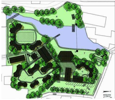
Gambar 4. Site Plan Sekolah Alam Ciganjur

sehingga terdapat harmonisasi dengan alam sebagai objek pembelajaran.