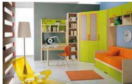
Gambar 2. Warna Cerah Pada Ruang Belajar Anak.

membuat objek kelihatan lebih besar dan ringan dari pada sesungguhnya. Sementara warna gelap membuat mereka lebih kecil dan berat.