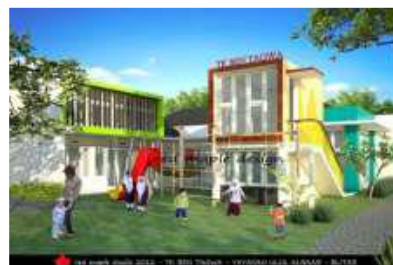
Gambar 3. Penggunaan Warna Cerah untuk Menciptakan Suasana Riang.

Penggunaan komposisi warna-warna cerah dan warna-warna kontras pada ruang akan menciptakan suasana gembira atau riang.