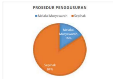
Gambar 2. Persentase prosedur penggusuran tahun 2015 oleh pemerintah

Pada gambar di bawah menunjukkan grafik persentase prosedur penggusuran yang dilakukan oleh pemerintah.