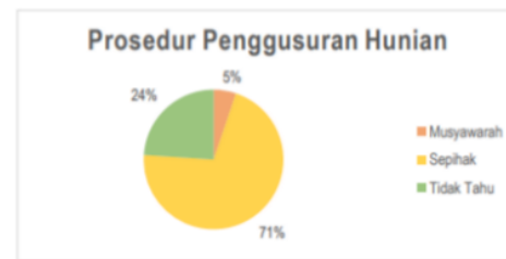
Gambar 3. Persentase prosedur penggusuran tahun 2016 oleh pemerintah

Pemaksaan ini walaupun ditujukan untuk perbaikan infrastruktur dan lingkungan skala yang lebih besar, tetapi perlu diingat perbuatan yang sepihak ini tidak dibenarkan menurut Committee on Economic, Social and Cultural Rights, General Comment 7, Forced evictions, and the right to adequate housing (Sixteenth session, 1997), U.N. Doc. E/1998/22, annex IV at 113 (1997) pasal 2 yang menyatakan, The International community has long recognised that the issue of forced evictions is a serious one. In 1976 the Vancouver Declaration on Human Settlements noted that "major clearance operations should take place only when conservation and rehabilitation are not feasible and relocation measures are made" .