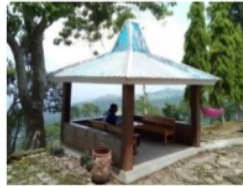
Gambar 5. Gazebo