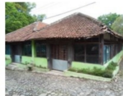
Gambar 3. Aula