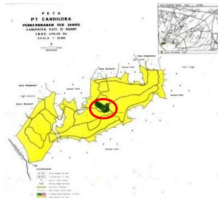
Gambar 1. Lokasi Penelitian

Lokasi penelitian berada di Kebun Teh Jamus di Desa Girikerto, Kecamatan Sine, Kabupaten Ngawi.