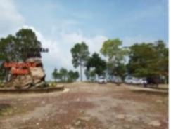
Gambar 11. Lahan parkir