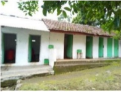
Gambar 6. Toilet