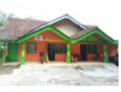
Gambar 13. Balai pengobatan