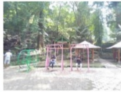
Gambar 7. Tempat bermain