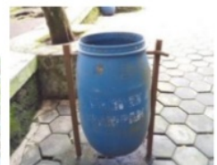
Gambar 9. Tempat sampah