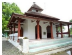
Gambar 8. Mushola