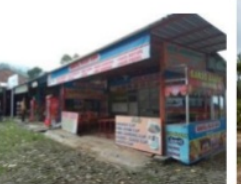
Gambar 10. Tempat makan