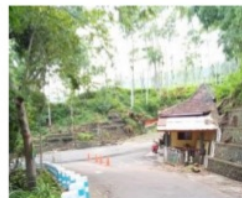
Gambar 2. Pintu Masuk

Berdasarkan hasil pengamatan kondisi pada objek wisata Kebun Teh Jamus masih sangat alami dan tradisional. Gambar 2- 7 memperlihatkan sarana prasarana yang tersedia di Kebun Teh Jamus Ngawi.