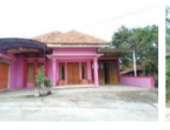
Gambar 12. Homestay