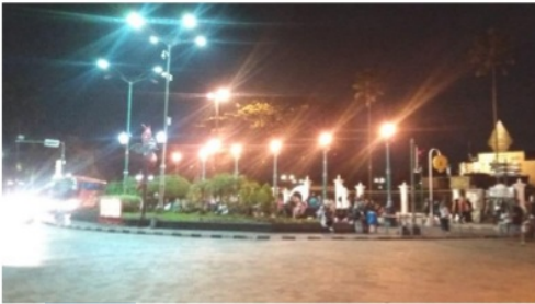
Gambar 7. Sudut pandang zona 2 dari zona 1

Gambar 8 merupakan penggabungan data pengamatan titik atraksi dan fasilitas dengan titik kepadatan atau keramaian wisatawan di zona 1 dan 2. Titik kepadatan wisatawan digambarkan dengan warna biru. Ketebalan warna biru mengartikan titik paling padat/ramai wisatawan. Sebagaimana ditunjukkan gambar tersebut, zona 2 memiliki tingkat kepadatan lebih tinggi dibandingkan zona 1. Karakteristik zona 2 yang lebih terbuka cenderung lebih diminati wisatawan dibandingkan pemadatan atraksi wisata di zona 1 yang membuat karakteristik ruang lebih padat. Selain itu lampu-lampu yang juga berfungsi sebagai atraksi pameran batik yang terdapat di zona 1 juga kurang diminati wisatawan.