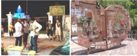
Gambar 1. Atraksi non permanen Titik Nol

atau daya tarik wisata terdiri dari atraksi permanen berupa bangunan bersejarah dan atraksi temporer berupa pertunjukan seni dan pameran seni patung.