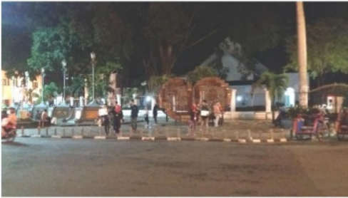
Gambar 6. Sudut pandang zona 1 dari zona 2

untuk pameran batik. Bentuk ruang yang lebih tertutup juga mengakibatkan zona 1 menjadi tempat buang air kecil bagi beberapa pedagang kaki lima dan tukang becak di sekitar tempat ini. Keadaan tersebut menjadikan zona 1 memiliki aroma yang kurang sedap yang dapat dirasakan saat melintasi zona ini. Variabel ketiga terkait pencahayaan didapati di zona 1 memiliki pencahayaan lebih redup, sehingga menjadikannya tidak banyak disinggahi oleh wisatawan. Redupnya pencahayaan dan karakteristik ruang yang lebih tertutup pada zona 1 menyebabkan rasa tidak nyaman bagi wisatawan untuk duduk-duduk atau singgah di zona ini.