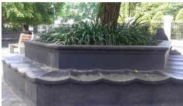
Gambar 3. Kursi pohon di area penelitian