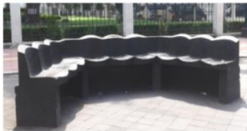
Gambar 2. Kursi taman di area penelitian

Fasilitas yang tersedia di kawasan ini adalah kursi taman, kursi pohon, lampu taman yang juga dimanfaatkan sebagai fasilitas untuk memajang jenis-jenis batik, tempat sampah, dan papan penunjuk arah. Berdasarkan hasil pengamatan, fasilitas yang paling sering digunakan wisatawan adalah kursi taman, sedangkan kursi pohon cenderung jarang digunakan karena terletak di titik yang kurang pencahayaan.