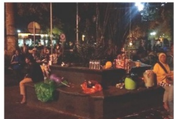
Gambar 4. Pemanfaatan kursi pohon oleh pedagang

Kurangnya pencahayaan mengakibatkan timbulnya rasa kurang nyaman bagi wisatawan untuk berada di area kursi pohon. Selain itu, kursi pohon seringkali digunakan pedagang dan tukang becak untuk beristirahat dengan cara duduk maupun berbaring. Gambar 5 menunjukkan pemetaan titik atraksi dan fasilitas di area penelitian.