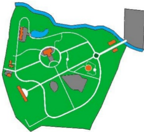
Gambar 1. Masterplan

penyeberangan. Jalur pejalan kaki terkoneksi dengan seluruh atraksi dan fasilitas yang disediakan oleh KRI, seperti terlihat pada Masterplan di Gambar 1 dan 2.