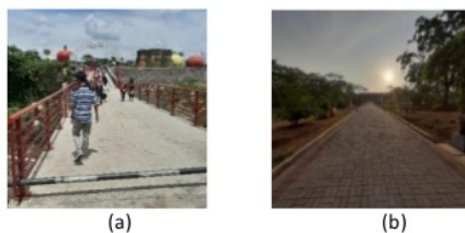
Gambar 2 Fasilitas Pejalan kaki: (a) Jembatan, (b) Pedestrian.