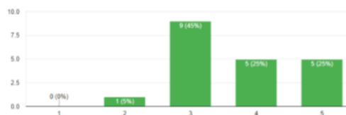
Gambar 4. Kepuasan Pengunjung

Evaluasi Subjektif diperlukan untuk memberikan penilaian kepuasan pengunjung terhadap fasilitas yang tersedia di kawasan ini. Gambar 4 adalah hasil penilaian subjektif.