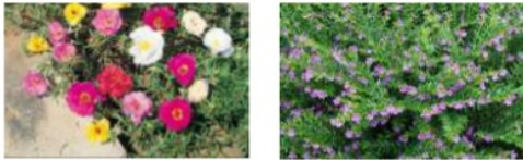
Gambar 12. Sutra Bombay dan Taiwan Beauty .

Terdapat tanaman hias untuk menambah faktor estetika. Menggunakan taman bunga dengan warna mencolok dan bau yang berbeda-beda dimaksudkan agar menjadi media pembelajaran siswa. Tanaman hias menggunakan Sutra Bombay dan Taiwan Beauty serta penutup dengan menggunakan rumput gajah mini.