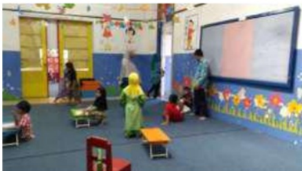
Gambar 10. Ruang kelas di TK Lazuardi.

Fasilitas ruang kelas di cat dengan warna biru memberikan kesan sejuk dan tenang dengan ornamen. Terdapat juga karya siswa yang digantung sebagai pemanis interior. Lantai ditutupi dengan karpet untuk menambah faktor keamanan anak.