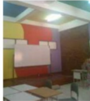
Gambar 9. Ruang Kelas di SAIMS

cerah untuk merangsang anak untuk kreatif dalam belajar. Furniture seperti papan tulis, meja, dan kursi digunakan menyesuaikan dengan skala tubuh anak. Terdapat area di dinding untuk memamerkan hasil karya anak.