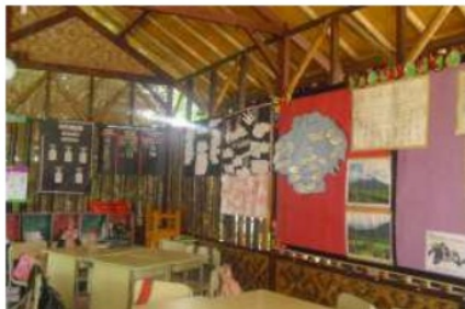
Gambar 13. Ruang Kelas.

Ruang kelas menggunakan material kayu dan bambu dengan konsep kelas saung di area terbuka.