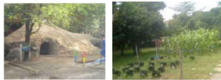
Gambar 8. Salah Satu gua ruang pembelajaran anak dan Area pembelajaran bercocok tanam di SAIMS

Sekolah Alam Insan Mulia Surabaya (SAIMS) menerapkan model pembelajaran yang membuat anak tetap riang gembira di saat sekolah berlangsung ( joyful learning ). Prinsip dasarnya adalah anak akan belajar secara efektif bila dia berada dalam kondisi fun dan nyaman. Sekolah didesain menjadi tempat belajar yang menyenangkan sehingga anak menjadi kerasan. Siswa tidak hanya belajar di dalam kelas, tetapi juga belajar di ruang terbuka, alam bebas maupun di arena bermain edukatif. Di SAIMS siswa belajar kecakapan hidup ( life skill ) secara utuh tidak parsial seperti di sekolah konvensional.