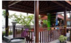
Saung ruang bakat