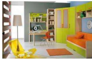
Gambar 2. Warna Cerah Pada Ruang Belajar Anak.

membuat objek kelihatan lebih besar dan ringan dari pada sesungguhnya. Sementara warna gelap membuat mereka lebih kecil dan berat.