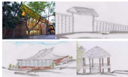
Gambar 15. Gambar Tampilan Bangunan

Pagar terbuat dari bambu. Tanaman bambu dapat berfungsi sebagai barrier suara dan juga merupakan material yang disediakan oleh alam. Bangunan penerima dan pengelola menggunakan material bambu dan kayu memberikan kesan menyatu dengan alam. Untuk bagian atap menggunakan bahan ijuk yang dibuat bertumpuk. Ruang kelas merupakan saung dari kayu dan bambu tanpa dinding.