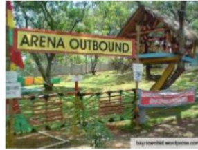
Gambar 14. Area Outbound .

Area Outbond dilengkapi dengan fasilitas yang bermanfaat untuk mendekatkan diri dengan alam dan juga melatih kemandirian, sosial dan kepercayaan diri anak.