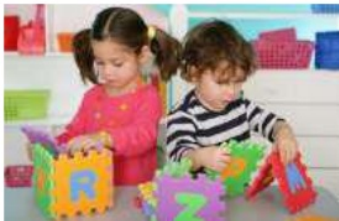
Gambar 1. Anak Bermain dengan Puzzle Warna.

Warna berperan sebagai rangsangan anak untuk beraktivitas dan berimajinasi dengan menggunakan warna cerah yang disukai anak dan menarik perhatian mereka, baik pada mainan akan ataupun warna ruang (lihat gambar 1 dan 2).