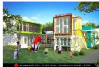
Gambar 3. Penggunaan Warna Cerah untuk Menciptakan Suasana Riang.

Penggunaan komposisi warna-warna cerah dan warna-warna kontras pada ruang akan menciptakan suasana gembira atau riang.