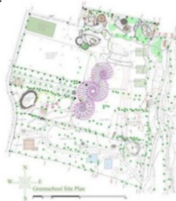
Gambar 6. Site plan Greenschool Bali.

Green School Bali didirikan pada tahun 2006 oleh John Hardy. Sekolah dibuka pada September 2008 dengan 90 siswa dan sebelumnya merupakan lahan perkebunan dan sawah. Sejak saat itu secara fisik dan jumlah murid terus mengalami peningkatan setiap tahun.