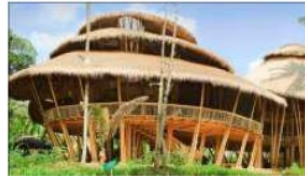
Gambar 7. Tampak Greenschool Bali.

Sekolah ini melakukan inovasi dengan mengambil bentuk unik yang tidak akan ditemukan di sekolah lain. Material utama dari bangunan di sekolah ini adalah bambu, alang-alang, rumput gajah, dan tanah liat di atasnya (lihat gambar 6). Semua konstruksinya merupakan material alam yang dapat di daur ulang dan juga mempunyai nilai kelokalan. Ruang kelas di desain tanpa sekat dan dinding beton sehingga memaksimalkan penghawaan alami. Green School di Bali, Indonesia memberikan pendidikan alam, holistik dan berpusat pada siswa. Meskipun mata pelajaran konvensional juga turut diajarkan, Green School lebih menekankan pada metode pendidikan yang berbasis holistik, mempersiapkan siswa siswinya menjadi individu yang kritis, kreatif, serta sadar lingkungan. Ini berarti, selain mempelajari algoritma, para siswa.