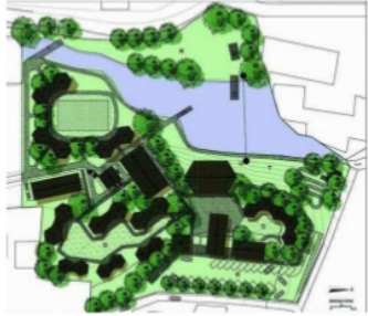
Gambar 4. Site Plan Sekolah Alam Ciganjur

sehingga terdapat harmonisasi dengan alam sebagai objek pembelajaran.