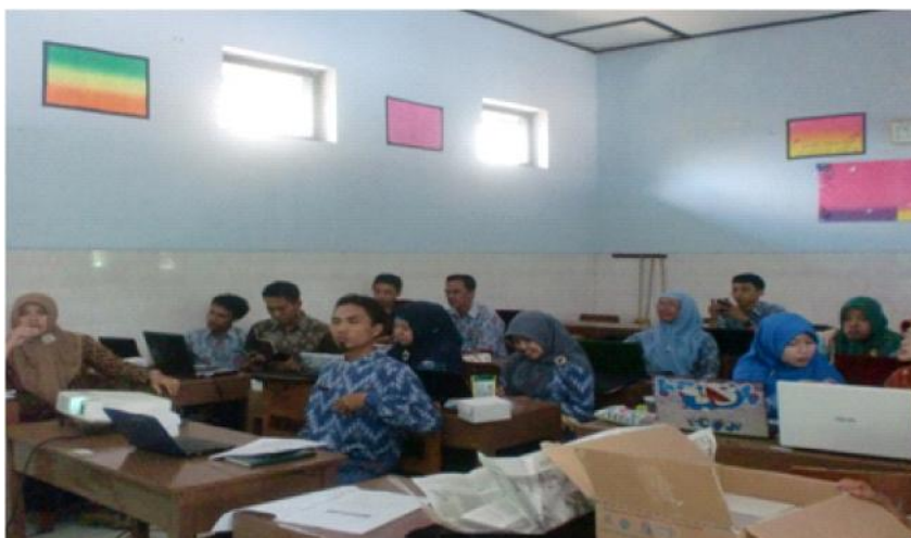
Gambar 1. Suasana pelaksanaan kegiatan pengabdian

Pelaksanaan kegiatan dibagi menjadi dua sesi utama yaitu pengenalan media pembelajaran bola voli berbasis web dan pelatihan pembuatan web. Sebelum sesi utama dimulai, peserta diminta untuk mengisi kuesioner pre-tes untuk mengetahui wawasan dan kemampuan awal peserta pelatihan mengenai kemampuan pembuatan web. Dari hasil kuesioner pre-tes dapat diketahui bahwa sebagian besar guru belum pernah menggunakan media pembelajaran berbasis web untuk kegiatan PBM pada mata pelajaran yang diampunya. Suasana pelaksanaan kegiatan pengabdian dapat dilihat pada Gambar 1