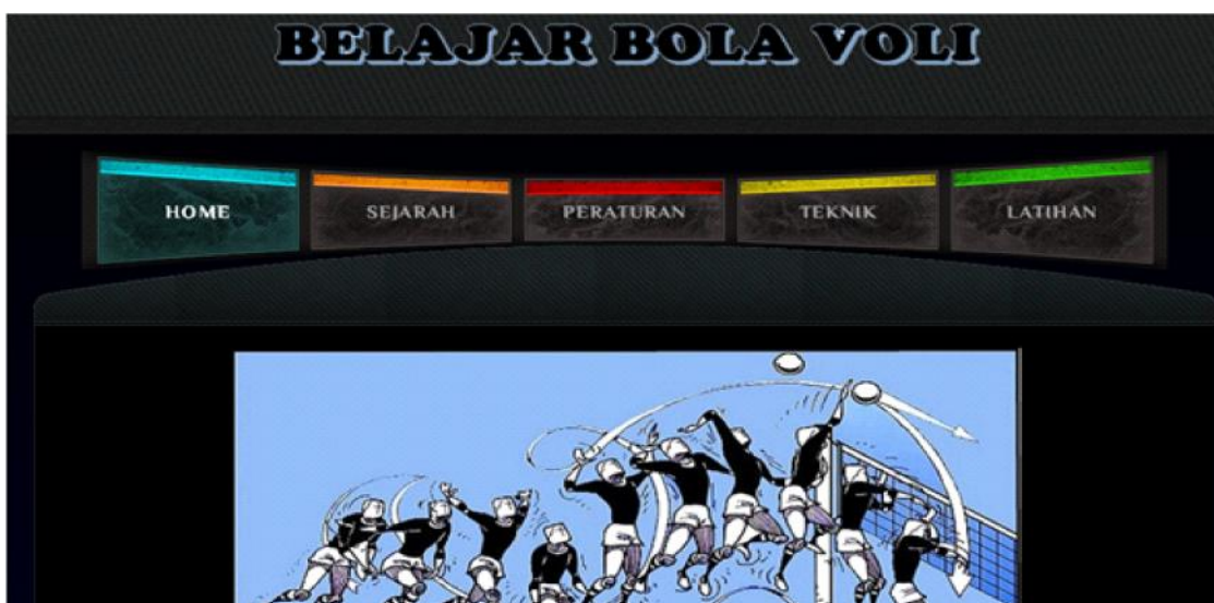
Gambar 2. Tampilan halaman muka media pembelajaran

Karena media pembelajaran ini digunakan untuk referensi bagi guru yang belum mengenal pengembangan media pembelajaran berbasis web, maka media pembelajaran dibuat tanpa menggunakan basis data. Tampilan halaman muka media pembelajaran yang dibuat oleh tim pelaksana pengabdian dapat dilihat seeperti pada Gambar 1. Pada halaman muka, dibagian atas dan bagian bawah terdapat tombol-tombol menu yang ada pada media pembelajaran yaitu meliputi halaman home (halaman muka), sejarah, peraturan, teknik, dan latihan. Apabila pengguna menekan tiap-tiap tombol menu tersebut, maka akan tertampil halaman sesuai dengan menunya. Beberapa tampilan media pembelajaran olah raga bola voli berbasis web yang diperkenalkan dapat dilihat pada Gambar 2 dan Gambar 3.