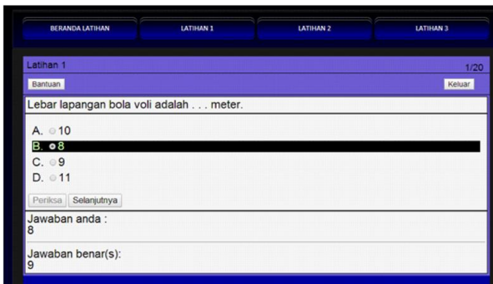
Gambar 6. Salah satu contoh tampilan soal latihan yang sudah dijawab.

pilihan jawaban yang tersedia lalu menekan tombol Periksa untuk mengecek apakah jawabannya benar atau salah, apabila jawaban benar akan muncul tulisan jawaban benar sedangkan apabila jawaban salah akan muncul pemberitahuan tentang jawaban yang dipilih pengguna dan apa jawaban yang benar. Contoh tampilan soal latihan yang sudah dijawab dapat dilihat pada Gambar 6.