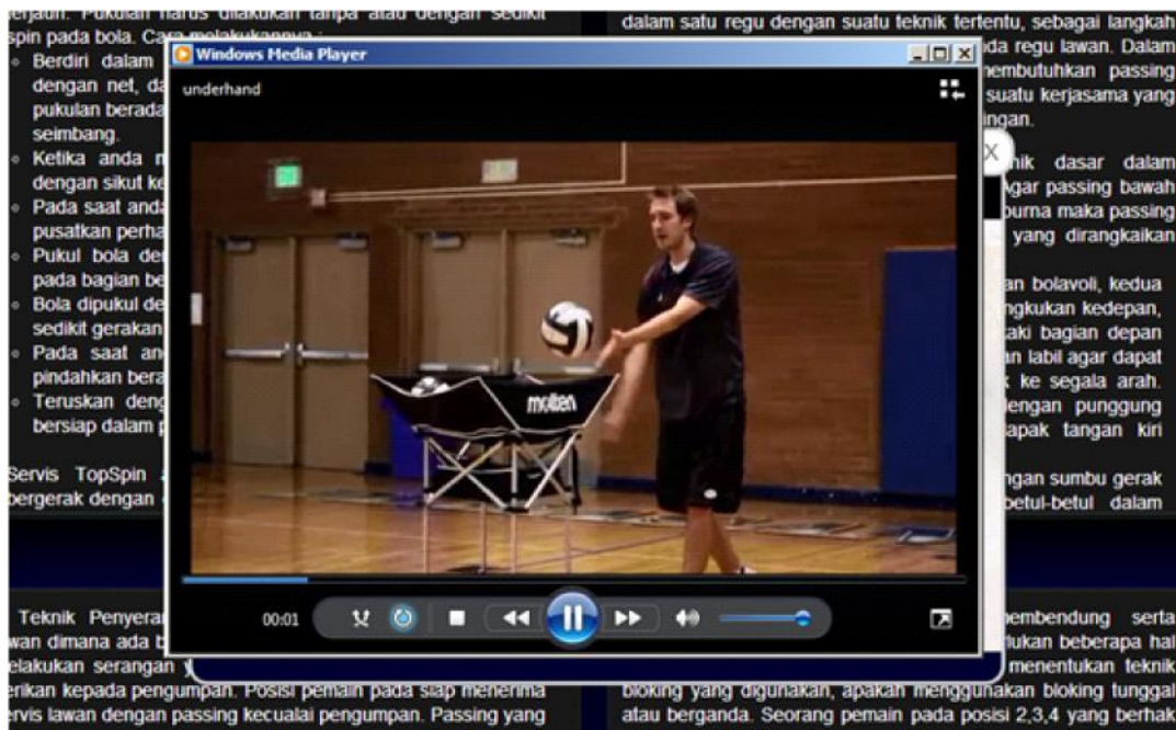
Gambar 5. Tampilan salah satu visualisasi video teknik permainan bola voli.

Dengan adanya visualisasi teknik dalam bentuk video maka pengguna atau siswa dapat mempraktekkannya secara langsung untuk latihan secara mandiri. Fitur lain dari media pembelajaran yang dibuat adalah adanya latihan soal yang dapat dikerjakan mandiri oleh siswa yang sudah dilengkapi dengan jawaban. Siswa diminta menjawab pertanyaan dengan cara mengklik