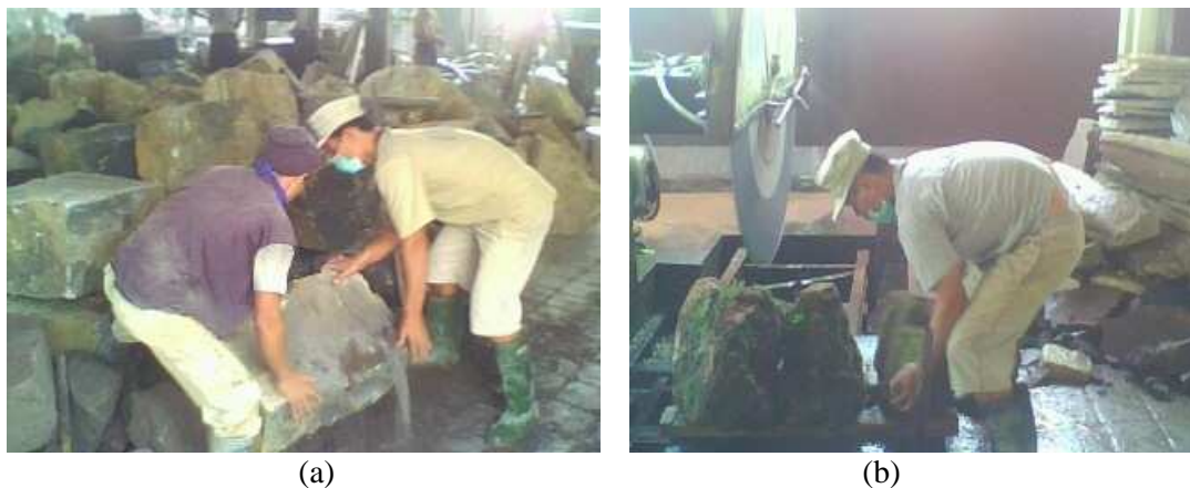
Gambar 1. Posisi kerja operator, (a) pengangkutan batu (b) pengaturan posisi batu

Kondisi kerja tersebut terlihat membutuhkan energi yang banyak untuk melakukan pekerjaan ini. Apalagi pekerjaan ini dilakukan secara terus-menerus tanpa adanya waktu istirahat yang cukup bagi operator selama jam kerja. Operator melakukan istirahat dengan cara mencuri waktu istirahat selama bekerja sebesar 3 menit setiap jamnya. Hal ini dapat memungkinkan timbulnya beban kerja yang tinggi sehingga dapat menimbulkan kelelahan bagi tubuh yang dapat menyebabkan tingkat performansi kinerja operator mesin pemotong tersebut dapat menurun. Kebisingan yang diakibatkan oleh proses pemotongannya mencapai 112,1 dBA sehingga menimbulkan suara bising yang tak terkendali. Gambar 1 menunjukkan aktifitas operator saat pengangkutan dan pemasangan batu sirkel 60 cm pada mesin pemotong.