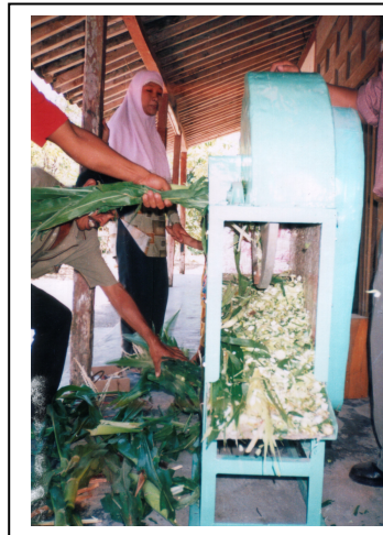
Gambar 1. Mesin pencacah pakan

Bagi kalangan peternak menengah ke bawah, rekayasa mesin pencacah pakan sapi dapat mengatasi kekurangan pakan. Dengan mesin ini, berbagai bahan pakan dapat dicacah dengan ukuran kecil-kecil sehingga habis dimakan oleh sapi. Bahan yang biasa diolah dengan mesin ini di musim kemarau antara lain pohon jagung, pohon papaya, pohon singkong, dan ranting-ranting muda. Pengadaan mesin pencacah ini mampu mengatasi kekurangan pakan sapi perah dan sekaligus dapat mempertahankan produksi susu, khususnya di musim kemarau.