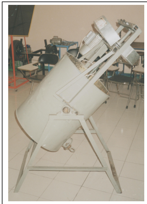
Gambar 4. Prototype mesin pencampur pakan sapi basah (komboran basah)