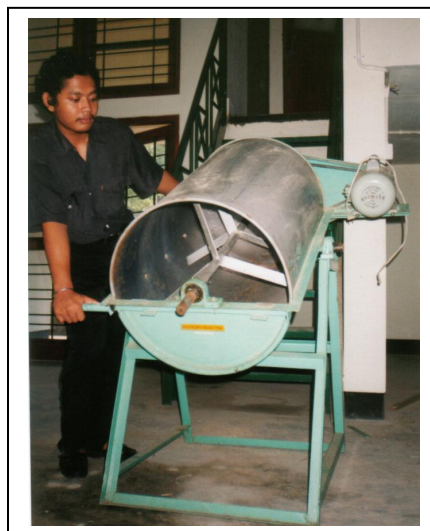
Gambar 2. Mesin pencampur pakan kering (Kusharjanta dkk, 2004)