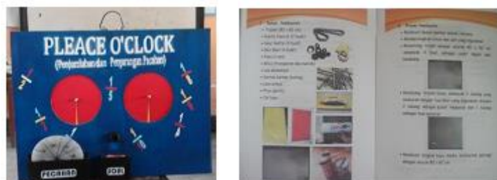
Gambar 3. Media dan Buku Pedoman Sudah direvisi

Media place o'clock telah memberikan kemudahan siswa dalam memahami materi penjumlahan dan pengurangan pecahan. Karena media mampu mendorong