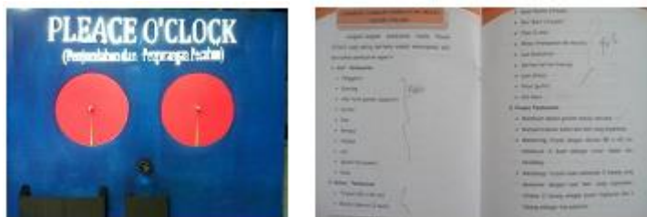
Gambar 2. Media dan Buku Pedoman Sebelum direvisi