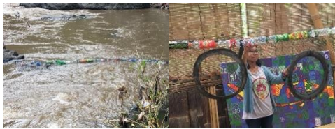
Gambar 6. River Booms