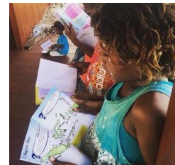
Gambar 5. Education Booklet

Bentuk kegiatan edukasi bagi siswa di beberapa sekolah tentang pemahaman akan sampah dan bagaimana cara menanggulangnya dengan tujuan agar siswa ditanamkan sejak dini tentang adanya permasalahan sampah plastik, yang kemudian diharapkan akan menjadi aksi nyata terhadap permasalahan sampah.