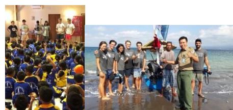
Gambar 2. Aksi 'Keliling Bali'

Bye Bye Plastic Bag juga melakukan aksi yang dinamakan 'Keliling Bali' . Aksi ini dilakukan oleh beberapa anak muda dari komunitas Bye Bye Plastic Bag . Mereka ingin mengelilingi perairan di beberapa wilayah di Bali dengan tujuan untuk mengecek kadar air yang terkandung di perairan tersebut. Dengan menggunakan kapal jukung yang dibuat dengan bahan ramah lingkungan serta alat-alat khusus untuk mengecek kadar air laut. Aksi ini dimulai pada tanggal 8 Juli 2018 menuju ke perairan laut barat Pulau Bali. Aksi ini sekaligus dimanfaatkan untuk memberikan edukasi bagi warga dan anak-anak lokal akan pentingnya melestarikan lingkungan dan pembelajaran tentang sampah.