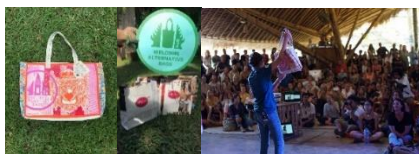
Gambar 3. Hasil Karya Mountain Mamas

Gerakan kepedulian terhadap wanita di daerah pegunungan untuk membuat sesuatu dengan keterampilan khusus, yang kemudian diperjualbelikan. Barang-barang tersebut merupakan sampah-sampah yang tidak bisa didaur ulang yang kemudian dimanfaatkan sebagai hasil karya seni.