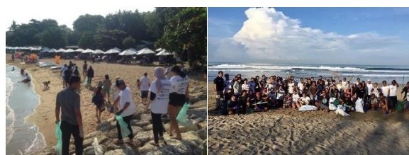
Gambar 8. Aksi One Island One Voice