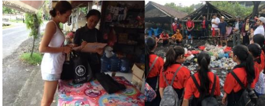
Gambar 7. Kegiatan Pilot Village

Sebuah usaha untuk menghapus penggunaan sampah plastik pada sebuah desa. Desa yang dituju oleh Bye Bye Plastic Bag adalah Desa Pererenan, Bali.