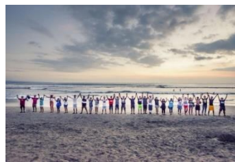
Gambar 1. Kegiatan 'Human Wave'

Di tahun 2018, Bye Bye Plastic Bag mengadakan event dalam rangka World Ocean Day dengan membuat 'Human Wave' dengan cara berjabat tangan satu dengan yang lainnya di beberapa lokasi yang dituju. Aksi ini dilakukan sebagai simbol bersatunya masyarakat untuk melindungi laut. Kegiatan ini dilakukan di beberapa pantai di Bali, yaitu: Pantai Batu Bolong, Genius Café – Sanur, Pantai Sawangan – Nusadua, Warung Amsha – Amed.