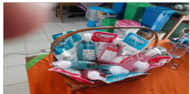
Gambar 8. Penyerahan Sabun Cuci Tangan Secara Simbolis di SDN 1 Cikalang