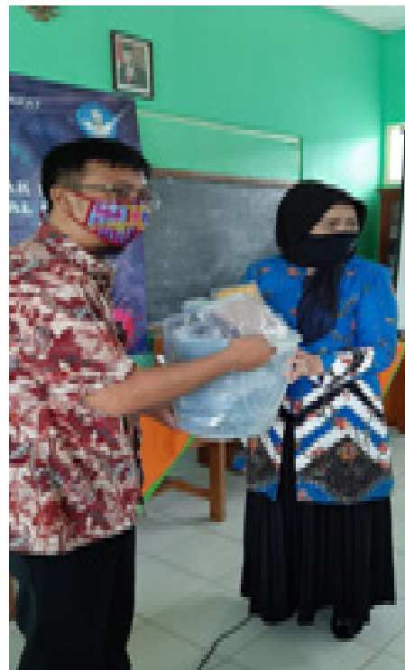
Gambar 10. Penyerahan Masker untuk guru dan Murid SDN 1 Cilolohan