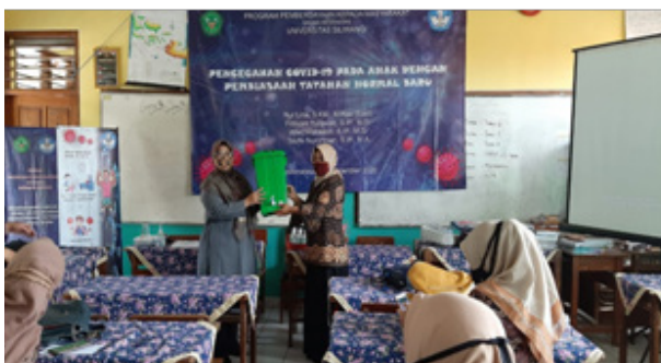
Gambar 3. Penyerahan Tempat Cuci Tangan Secara Simbolis di SDN1 Cikalang

Faktor pembawa virus Covid-19 adalah manusia yang terinfeksi virus Covid-19. Virus akan tumbuh menjadi banyak di sepanjang saluran pernapasan mulai dari rongga hidung, mulut, sampai paru-paru. Virus akan keluar pada saat orang berbicara, bersin, dan batuk, menyebar bisa sampai radius 1 meter lebih dari dan menempel di benda-benda sekitar. Penularan Covid-19 karena memegang benda sekitar yang tercemar virus tersebut tidak bisa dihindarkan. Rajin cuci tangan dengan memakai sabun efektif membunuh virus covid-19. Covid-19 memiliki tubuh terbungkus oleh dinding dari struktur kimia lemah yang sangat mudah hancur apabila terkena sabun itu sebabnya harus cuci