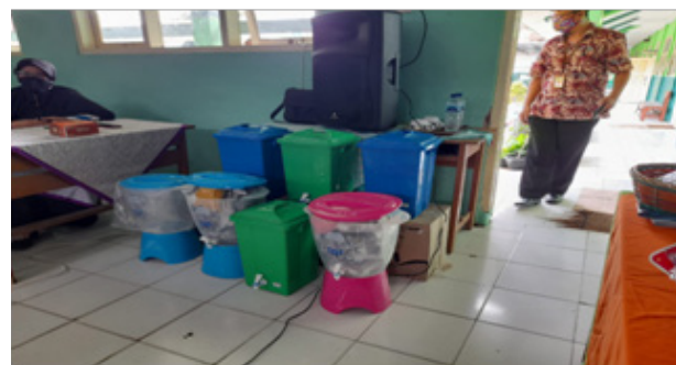
Gambar 4. Penyerahan Tempat Cuci Tangan di SDN Cilolohan