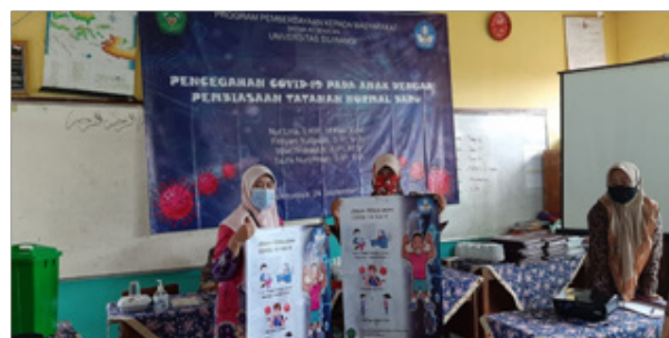
Gambar 2. Penyerahan Media Promosi Pencegahan Covid-19 di SDN Cilolohan