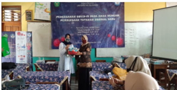
Gambar 7. Penyerahan Sabun Cuci Tangan Secara Simbolis di SDN 1 Cikalang