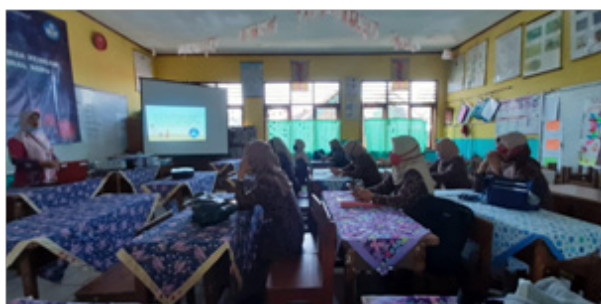
Gambar 1. KIE Mengenai Pencegahan Covid-19 pada Anak di SDN 1 Cikalang

KIE dilakukan melalui penyuluhan dengan materi tentang Covid-19 . Penyuluhan tentang Covid-19 dilakukan selama satu jam dimulai jam 10 pagi sampai dengan jam 11 diawali dengan pemberian pretest yang berisi 10 soal kemudian diberikan penyuluhan. Materi penyuluhan yang diberikan adalah upaya pencegahan terjadinya penularan Covid-19 pada anak. Setelah selesai penyuluhan diberikan posttest .