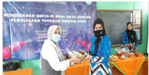
Gambar 6. Penyerahan Hand Sanitizer Secara Simbolis di SDN Cilolohan