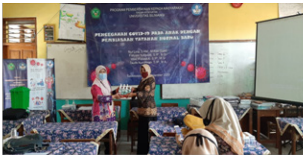
Gambar 5. Penyerahan Hand Sanitizer Secara Simbolis di SDN 1 Cikalang

Kader gerak aksi sekolah pandemi harus mengkampanyekan masker sebagai upaya melindungi anak-anak dan orang-orang lain. Jangan sampai droplet yang keluar dari diri anak-anak terkena pada orang lain. Jika lebih dari 75% penduduk patuh menggunakan masker, maka Covid-19 dapat turun secara drastis. Akan menekan kasus Covid-19 di Tasikmalaya pada khususnya dan di Indonesia pada umumnya. Hasil penelitian di Amerika, penggunaan masker kain oleh 80% populasi akan mengurangi 34 - 58% penambahan kasus kematian (Eikenberry et al, 2020). Hasil penelitian menyatakan bahwa permodelan penggunaan masker oleh minimal populasi tersebut sudah terbukti menekan peningkatan kasus baru dan kematian. Anak-anak tidak suka memakai masker dan kemungkinan besar akan mencobanya untuk melepas bahkan membuangnya, sehingga mereka lebih banyak menyentuh wajah. Mempersiapkan dan mengajarkan anak-anak yang sehat menggunakan masker sangat dibutuhkan untuk mendapatkan kepatuhan yang maksimal (Joko,