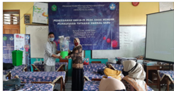
Gambar 9. Penyerahan Masker untuk Guru dan Murid SDN 1 Cikalang

Penulis mengucapkan terima kasih kepada Lembaga Penelitian dan Pengabdian masyarakat Universitas Siliwangi yang telah memberikan hibah Pengabdian Kepada Masyarakat Skema Kesehatan (PbM-SK), SDN 1 Cikalang, SDN Cilolohan, dan mahasiswa Program Studi Kesehatan Masyarakat dan mahasiswa Program Studi Ilmu Sosial dan Politik Universitas Siliwangi yang terlibat dalam kegiatan ini.