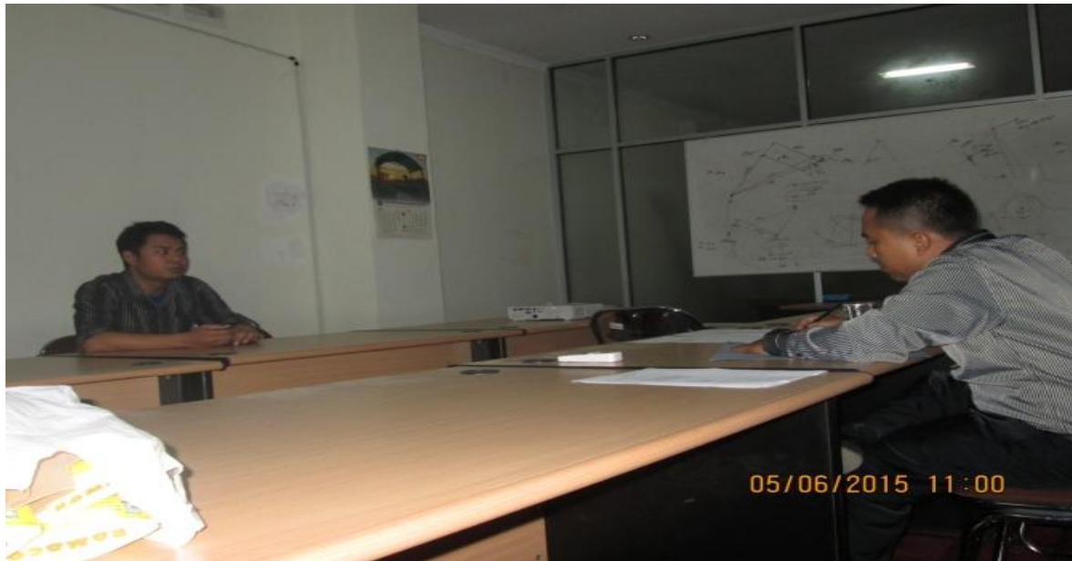
Gambar Rekrutmen Calon Peserta