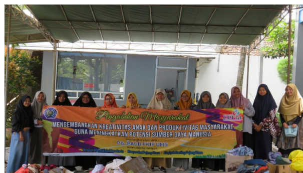
Gambar 1. Tim Pengabdian dan mitra, TK Islam Mardisiwi

Terlihat melalui gambar 1, adanya kerjasama dan kebersamaan yang kompak kegiatan ini berjalan dengan lancar. Panitia terdiri dari beberapa mahasiswa Pendidikan Guru Pendidikan Anak Usia Dini Universitas Muhammadiyah Surakarta. Sementara itu dari pihak mitra terdiri dari pihak TK Islam Mardisiwi Surakarta, para orang tua, anak-anak, maupun para remaja di kampung RW XI Pajang, Surakarta.