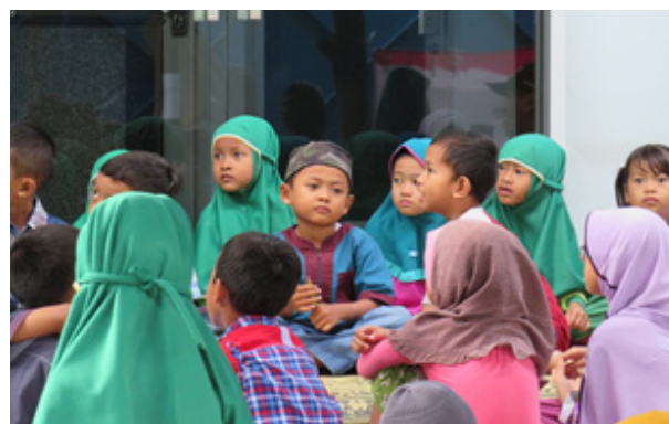
Gambar 2. Anak-anak didik TK Islam Mardisiwi sebagai peserta