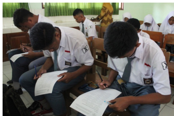
Gambar 1. Peserta Pelatihan