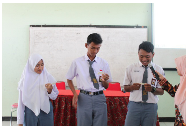
Gambar 2: Praktik wawancara

Efek dari kegiatan pelatihan ini terlihat dari ranah kognitif, yaitu siswa yang tidak mengetahui menjadi mengetahui dan memahami bagaimana proses pembuatan berita. Dari tempat terjadinya peristiwa, melakukan wawancara dan mengolah informasi menjadi berita yang layak dipublikasikan. Kegiatan yang pandu oleh dua orang dosen dan seorang awak media ini menarik perhatian peserta. Hal ini terlihat dari aktivitas pelatihan dengan pertanyaan yang diajukan dan siswa pun dengan senang hati tampil ke depan ketika diminta. Di akhir kegiatan, peserta diminta untuk mengisi lembar post test . Post test dilakukan untuk mengetahui sejauh mana tingkat pemahaman siswa setelah materi pelatihan disampaikan.